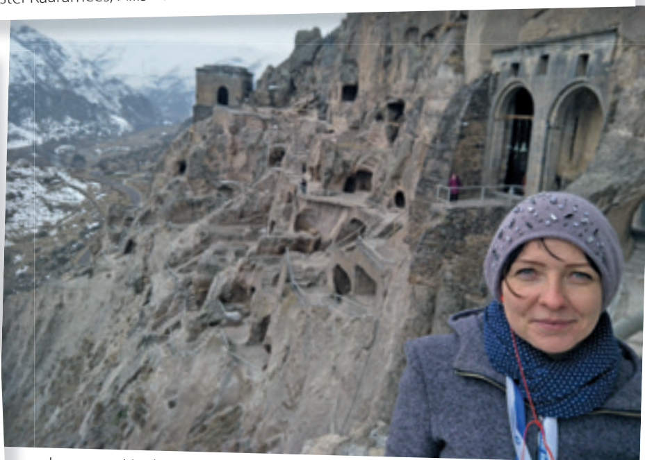
Loo autor Vardzia koobaslinna ees.