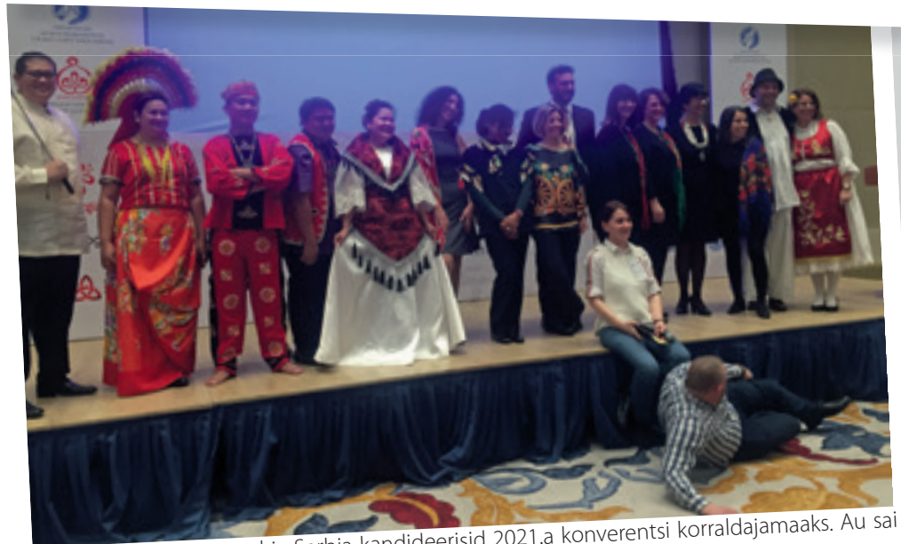
Filipiinid, Itaalia, Portugal ja Serbia kandideerisid 2021.a konverentsi korraldajamaaks. Au sai endale Serbia.

mis avanevat pilti veelgi maalilisemaks tegid, olgugi et aastaeg ei olnud turismiks kõige sobivam. Meie esimene ööbimispaik oli Bordžomi, kus loomulikult maitsestisime ka kuulsat vett otse allikast.